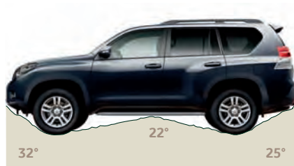
Vstopni, prehodni in izstopni kot