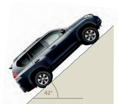
Največji kot vzpenjanja 42°